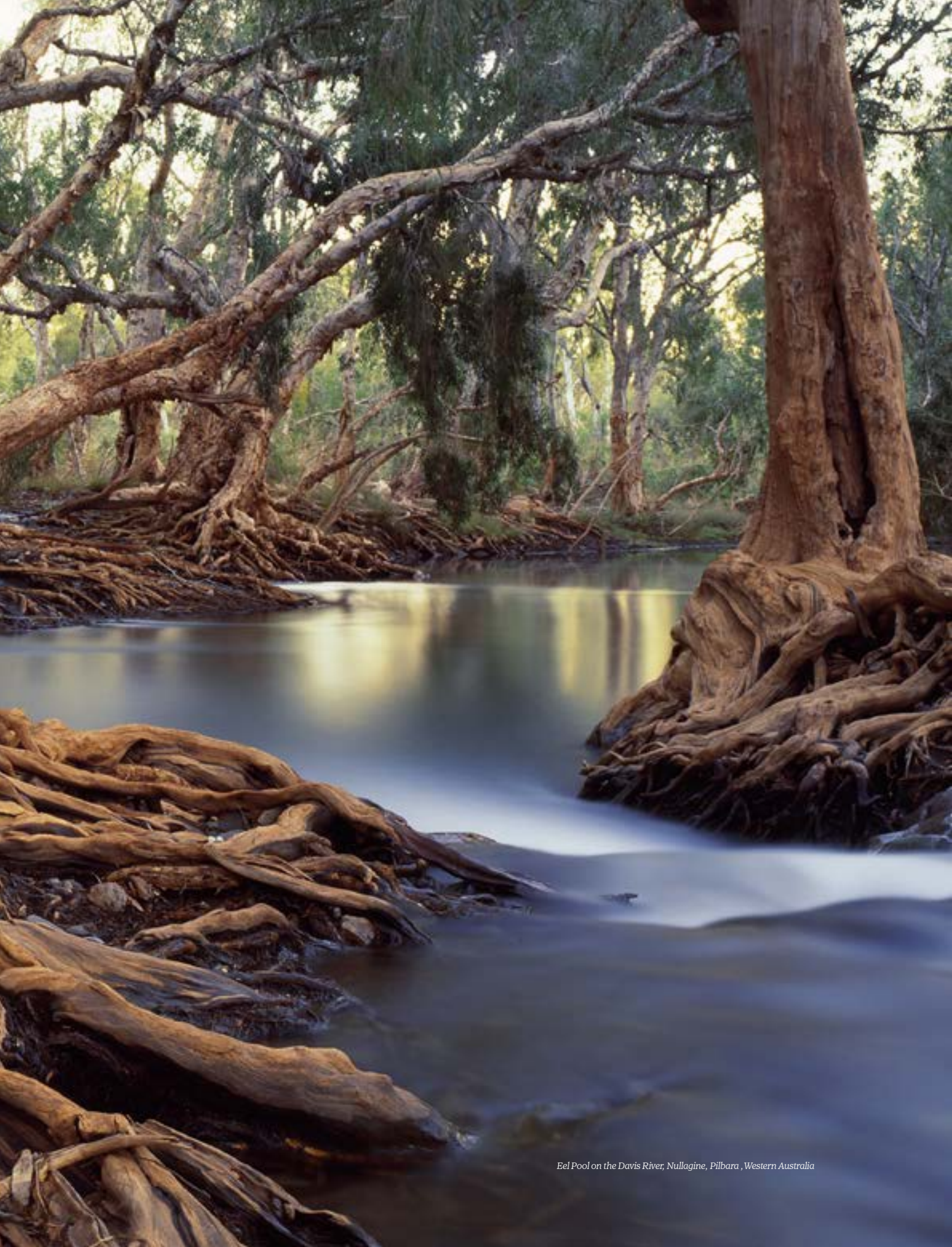
Eel Pool on the Davis River, Nullagine, Pilbara, Western Australia