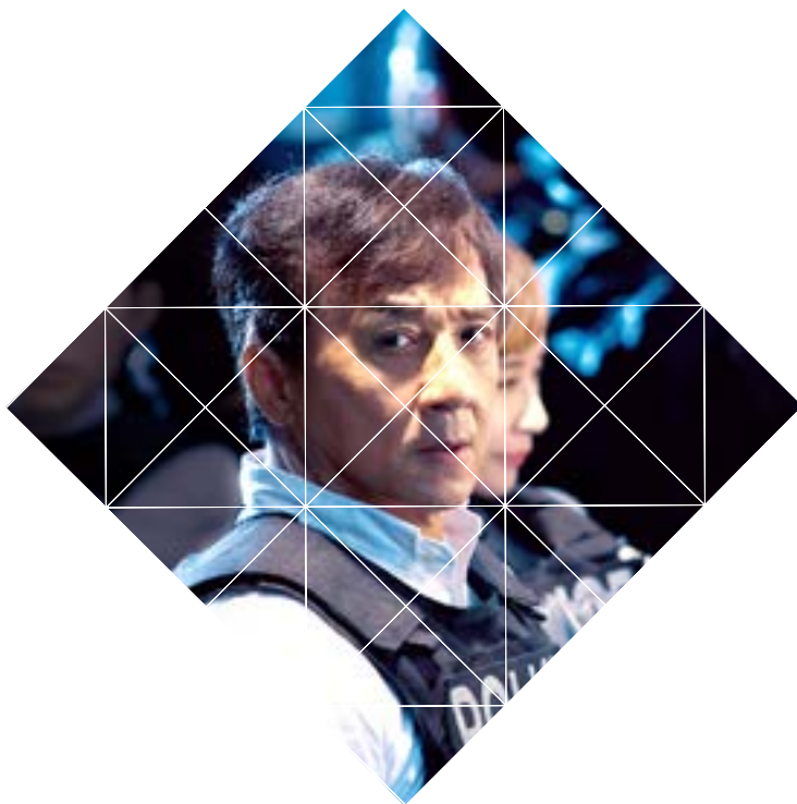
电影《机器之血》成龙剧照 Bleeding Steel