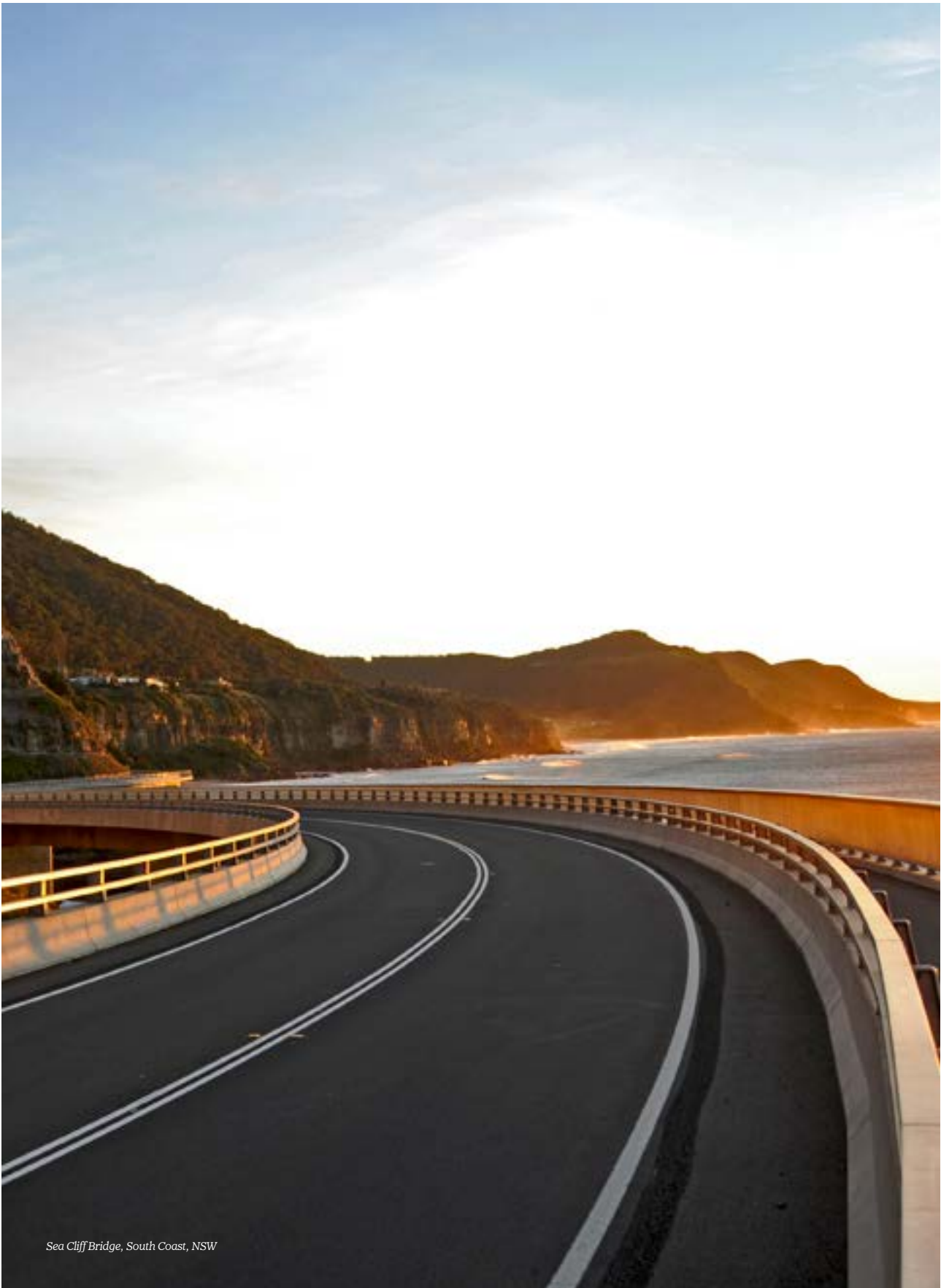
Sea Cliff Bridge, South Coast, NSW